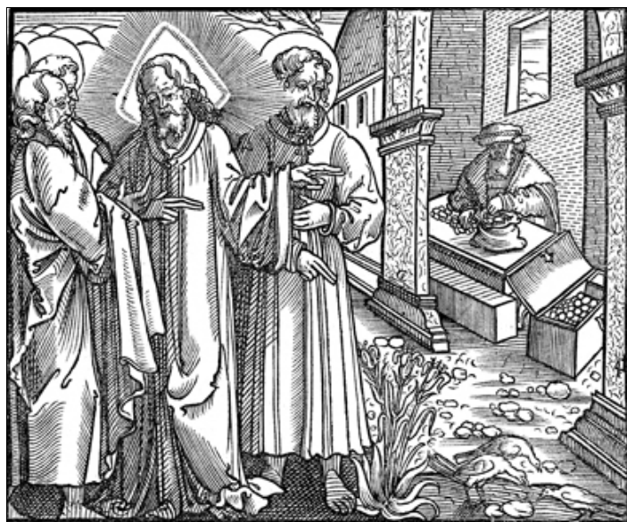
Jēzus māca par bagātību.

Nezināma autora kokgriezums Mārtaņa Lutera grāmatai, 1563. gads.