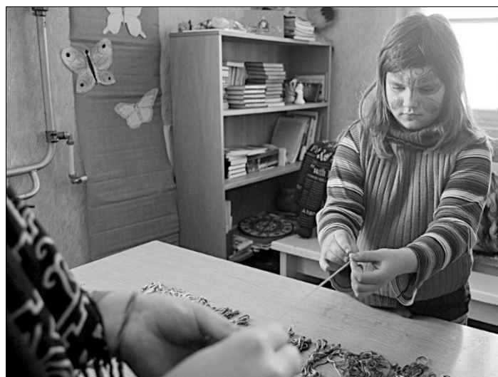
Maijai top pinīte.